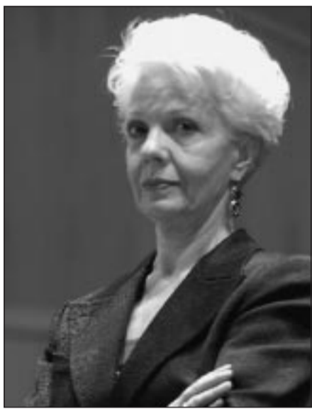
Il famoso soprano Raina Kabaiwanska