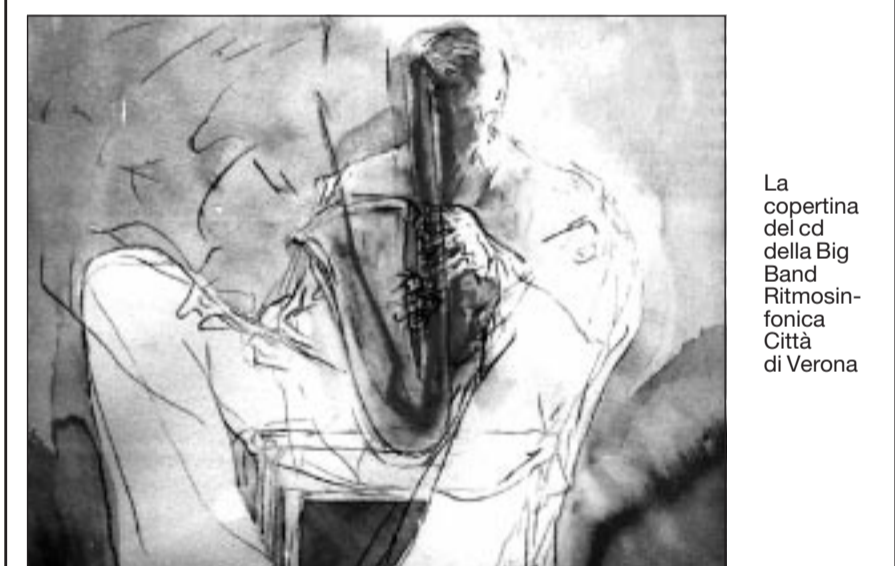
La copertina del cd della Big Band Ritmosinfonica Città di Verona

Il punto d'incontro di queste sue differenti anime, forse, sta proprio in uno dei suoi massimi eroi, quel Charles Bukowski cui ha dedicato il brano di chiusura dell'album, «L'ultima notte di un vecchio sporcaccione». Album con melodie facili e taglio radiofonico