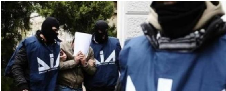
Nella foto di repertorio, un'operazione contro la criminalità organizzata