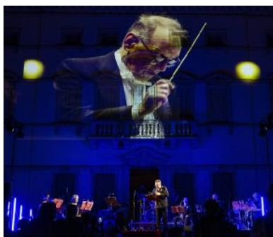
Il tributo a Ennio Morricone da parte della band «Città di Verona»