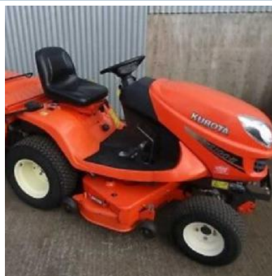
Il trattorino sottratto: ha un valore di 7 mila euro

vero non sappiamo a che santo votarci. Il furto del trattorino, il cui costo si aggira sui sette-mila euro, è un danno enorme per la nostra piccola società. A questo punto dovremo valutare come fare fronte al furto di un mezzo più che importante per le attività della squadra e del settore giovanile. Cercheremo di fare il possibile per garantire nell'immediato la corretta regolarità delle attività dei numerosi bambini della scuola calcio, dei ragazzi del settore giovanile e della prima squadra. Speriamo e confidiamo anche nel buon cuore di qualche benefattore, tra cui l'amministrazione comunale, per l'acquisto di un nuovo mezz-